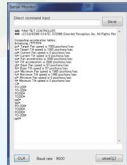
通信ログウィンドウ