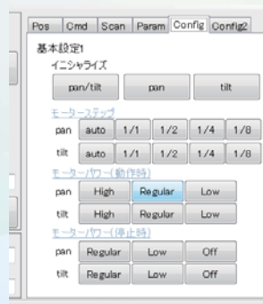
パラメータ設定パネル